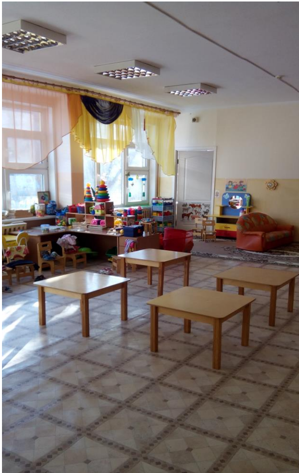
Фото № 9

Зона целевого назначения здания (целевого посещения объекта) признана доступной частично избирательно (У). Размещение информации о помещении на стене со стороны дверной ручки на высоте от 1,4 до 1,75 м с дублированием рельефным шрифтом, нанесение контрастной и рельефной поверхности за 0,6м перед дверью, выделение в зале не менее 5% специально оборудованных мест с возможностью усиления звука и дублированием звуковой и визуальной информации (организация сурдоперевода), организация ситуационной помощи в виде сопровождения персонала позволит сделать зону целевого назначения здания доступной условно всем остальным категориям инвалидов и МГН